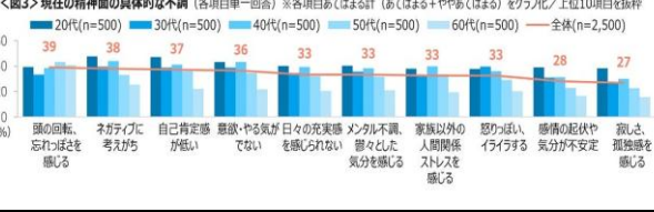
マイナビニュースより引用

【現在の健康状態】新型コロナウイルス感染症が五類に移行して一年近く経つ今回の調査では、まず現在の健康状態を聴いたところ、体調面については「睡眠の質の低下」「睡眠時間の不足」「目・首・肩の痛みが気になる」「頭痛が頻りに起こる」といった回答が目立ちました。一方で、「精神的に安定している」「ストレスを感じない」といった回答も目立ちました。また、「孤独感を感じる」「寂しさを感じる」といった回答も目立ちました。 【健康のために実行していること/今後強化したいこと】「散歩・ウォーキング」が最も多く、次に「ストレッチ」が挙げられました。また、「睡眠をしっかりとる」「テレビ・映画・動画を見る」「ゆっぴり、休む」なども多く挙げられました。 【ストレス解消やモチベーション強化など内面的な健康のために実行していること/今後強化したいこと】「睡眠をしっかりとる」が最も多く、次に「テレビ・映画・動画を見る」が挙げられました。また、「美味しいものを食べる」「散歩・ウォーキング」なども多く挙げられました。 【現在の体調面の具体的な不調】「目の不調」が最も多く、次に「肩・首すじのこわ・痛み」が挙げられました。また、「睡眠の質低下」「睡眠時間の不足」「スタイル、見た目の体型が気になる」なども多く挙げられました。 【現在の精神面の具体的な不調】「頭の回転、忘れっぽさを感じる」が最も多く、次に「ネガティブな考えが強い」が挙げられました。また、「自己肯定感が低い」「意欲・やる気がない」なども多く挙げられました。